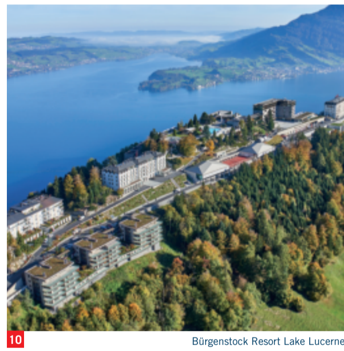
10 Bürgenstock Resort Lake Lucerne

BÜRGENSTOCK RESORT LAKE LUCERNE Bürgenstock Resort boasts three hotels, an elegant mix of modern architecture and the beauty of Belle Époque. Indulge in exclusive culinary experiences in 10 restaurants, bars & lounges. Enjoy the 10'000m 2 Alpine Spa with spectacular views over Lake Lucerne, or the Waldhotel Spa with stunning views over the surrounding Alpine mountain landscape. Behind the Bürgenstock Piazza, a hiking trail leads you to the 30-metre long Suspension Stairs (12) . From there, you can either walk around the Lakeview Residence Villas, ending again at the resort, or go down to Kehrsiten. burgenstockresort.com