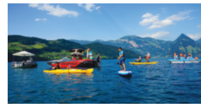
Wassersport-Aktivitäten an der Seemeile Water sports activities on the Seemeile

By car Take exit «Stansstad» from the motorway and follow the sign to «Bürgenstock». Parking and e-charging stations are available at the resort.