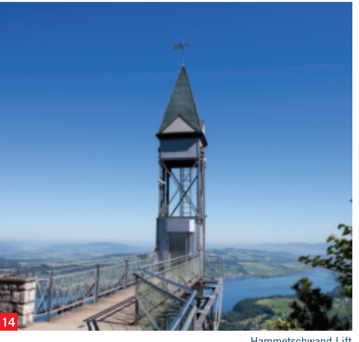
14 Hammetschwand Lift

BÜRGENSTOCK CLIFF WALK AND HAMMETSCHWAND LIFT The Cliff Walk leads high above Lake Lucerne from Bürgenstock Resort to the Känzeli view point. It is suitable for wheelchairs and prams. The Hammetschwand Lift (14) is a 30-minute walk from the Bürgenstock Resort. In one minute, the highest outdoor lift in Europe (152.8 m) leads from the Cliff Walk to the Hammetschwand. The Bärgeizli, the Cliff Walk and the lift are open from May to October, weather permitting. felsenweg.ch