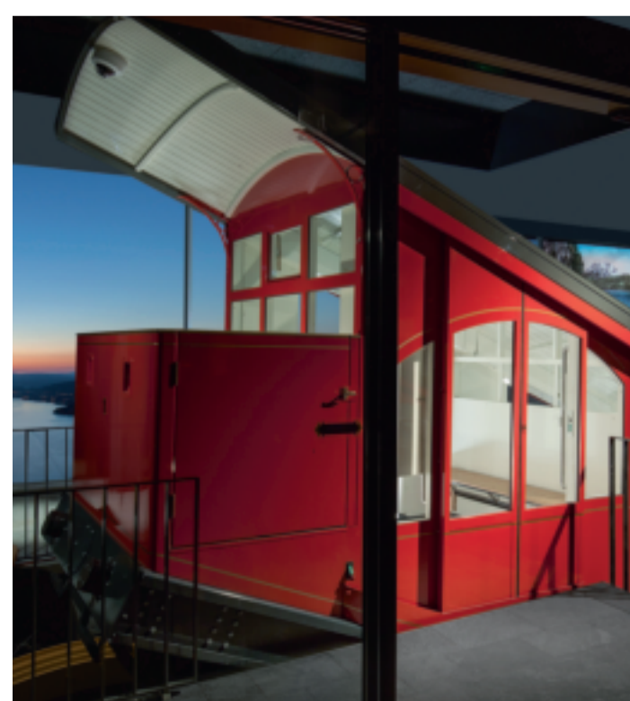
11 Bürgenstock Bahn | Bürgenstock Funicular

TRAILS OF MEMORY In 1798 the French invasion of Nidwalden occurred. The French and Nidwaldeners tell their stories at the French invasion in 1798 on the history trail with 11 panels. franzoseneinfall.ch