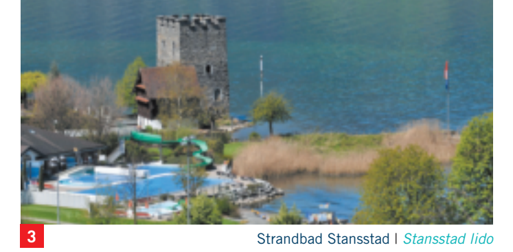
3 Strandbad Stansstad | Stansstad lido

STANSSTAD The region Stansstad includes the districts of Stansstad, Kehrsiten, Fügen and Obbürgen . The Schnitz tower (2) is the landmark of Stansstad. In the past, this watchtower was part of the lakeside fortress. In the 18th century the Sust (2) was used as a customs and warehouse. Today, numerous art exhibitions are held there. The fortress museum Fügen (4) of the Second World War is one of the most visited museums in the region of Nidwalden. Open from April to October. stansstad.ch