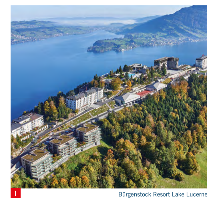
Bürgenstock Resort Lake Lucerne

BÜRGENSTOCK RESORT LAKE LUCERNE In the Bürgenstock Resort with its four hotels, you will enjoy an elegant mix of modern architecture and the glory of the art-nouveau age. A breathtaking view meets exclusive culinary experiences in 10 restaurants and bars and lounges. Relax in the 10'000 m 2 Alpine Spa with spectacular views over Lake Lucerne or in the natural Waldhotel Spa with views of the surrounding alpine mountain landscape. Behind the piazza of the Bürgenstock Resort, a hiking trail leads you to the 30-metre long Hanging bridge (K) . From here, you can get back to the Resort from anywhere around the Lakeview Residence Villas or can go down to Kehrsiten. burgenstockresort.com