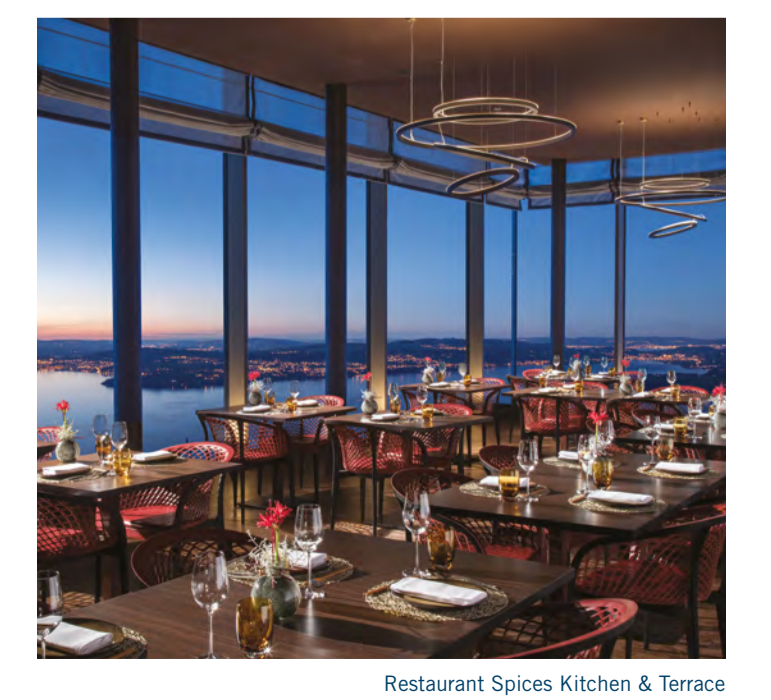
Restaurant Spices Kitchen & Terrace